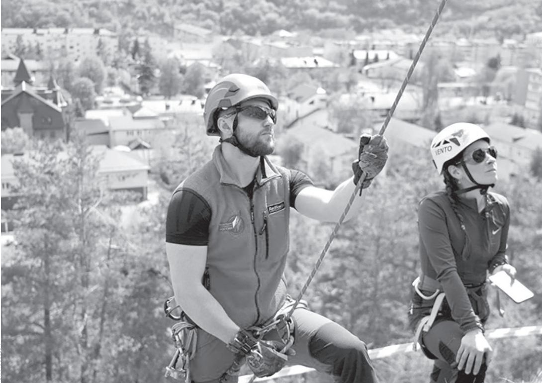
Карачаевск постепенно становится центром альпинизма